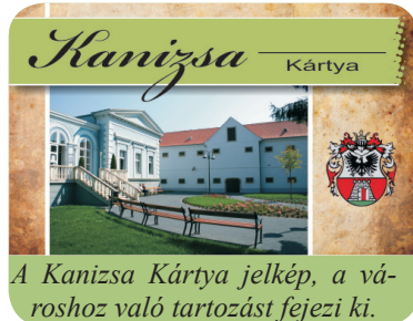
A Kanizsa Kártya jelkép, a városhoz való tartozást fejezi ki.