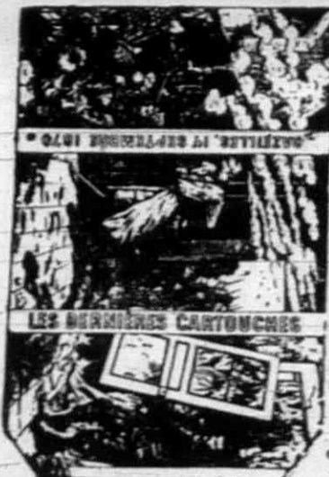
BRAUNSTEIN FRÈRES PARIS Rue de la Harpe, 112.

Nem üres reklám, hanem a tudomány legelőkelőbb személyiségei által bebizonyult tény, hogy a