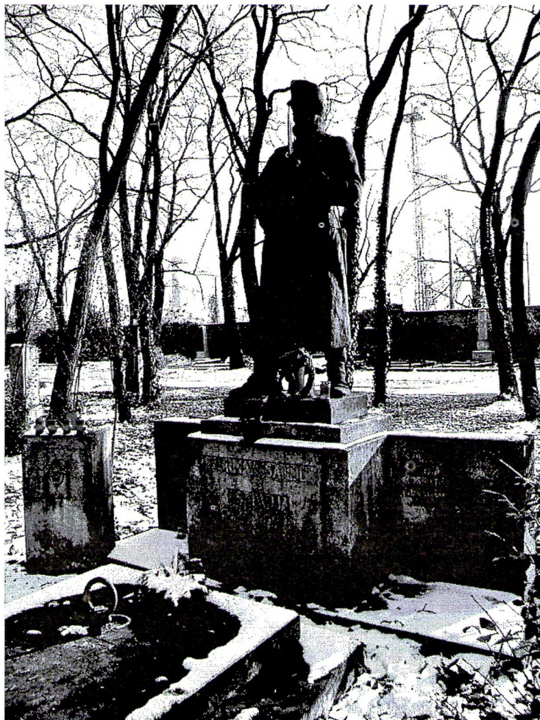
A Szurmay család nyughelye a Kerepesi temetőben