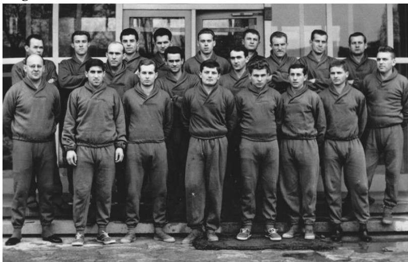
A Pécsi Dózsa a tatai edzőtáborban, 1967-ben.