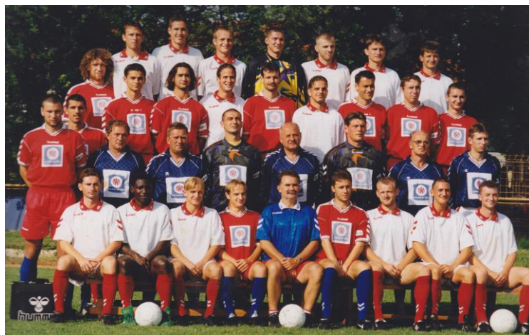
Az NB I-es csapat, 1999