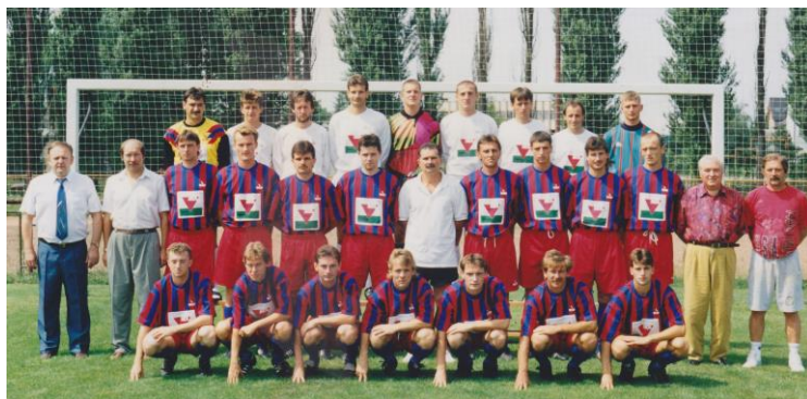
Az 1995-ös nagy csapat.