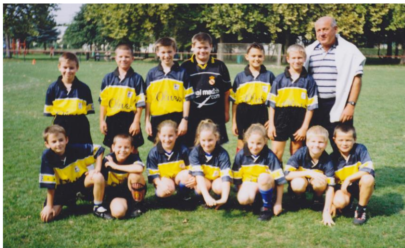
Az első csapatom, a kezdet kezdetén.