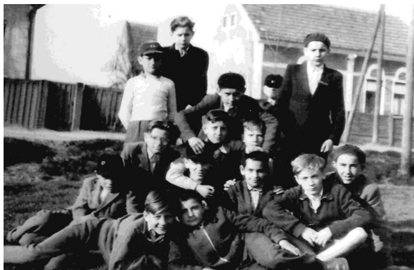
A Hunyady-téri, Flórián-téri vegyes csapat, bal szélén fekszem mosolyogva.