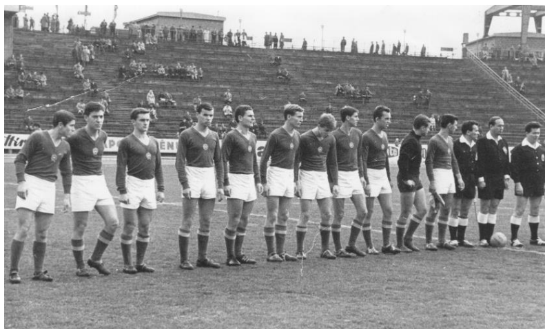
Csapatkép a magyar-osztrák előtt.

Tatabányán fogadtuk a Szovjetunió válogatottját, 2-0-ra nyertünk ellenük, majd októberben következett a magyar-osztrák, amit szintén 2:0-ra nyertünk meg.