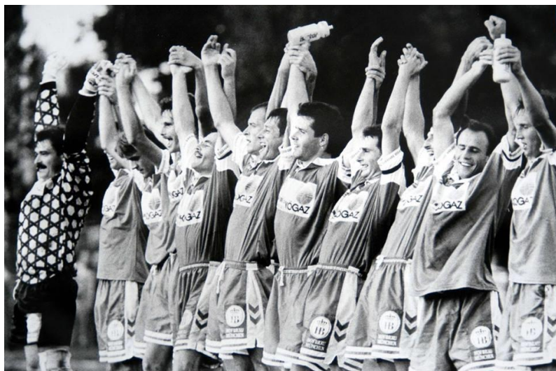
A bajnoki címet ünneplő csapat.

Ez a győzelem a bajnoki cím szempontjából fontos volt, reális eredmény született. Másik zalai rangadón Olajbányász – ZTE 2-0. Nagy lépés az NB I felé, a 10.000 néző már ünnepelte a feljutást, ám ez csak két hét múlva vált biztossá. A Paks 5-0-ás legyőzésével bajnok lett, és az NB I-be jutott a Nagykanizsai Olajbányász.