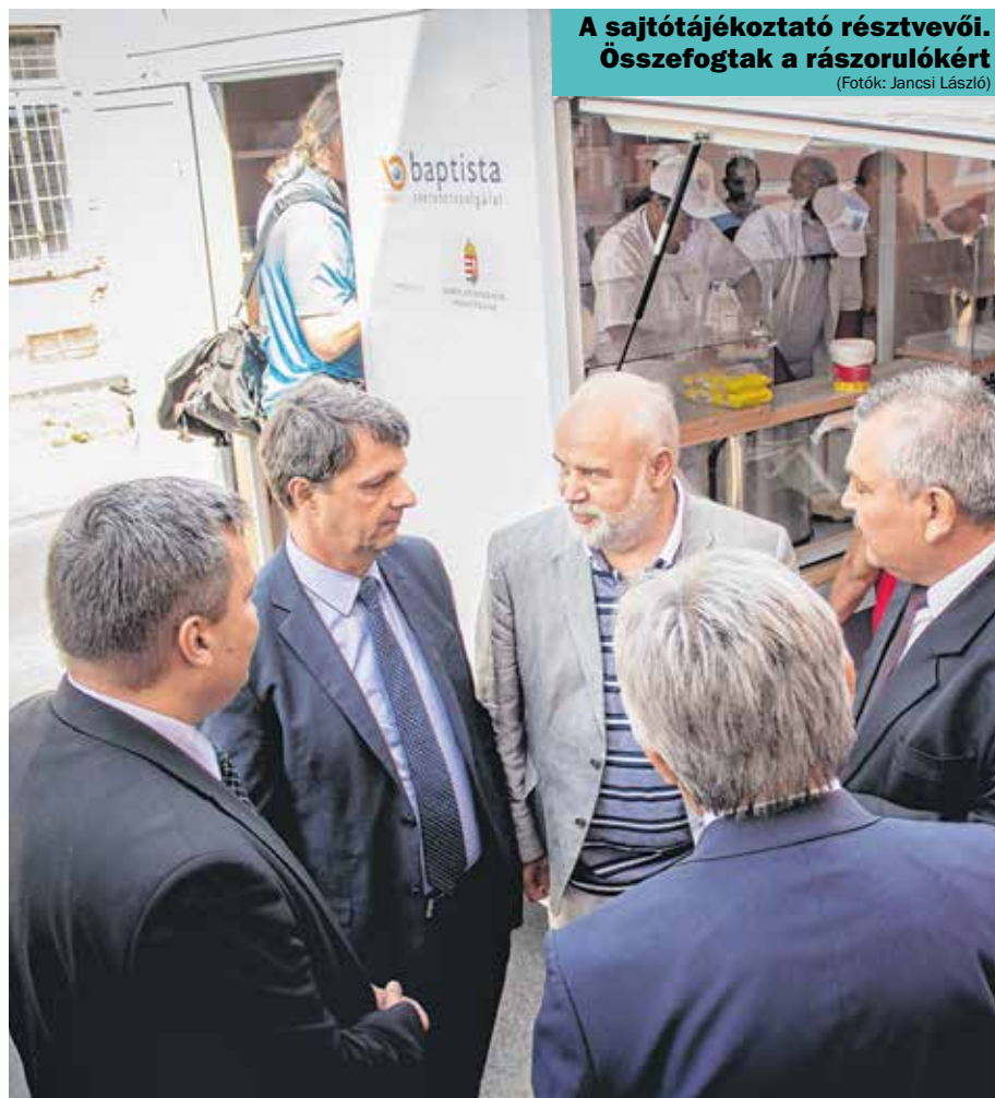
A sajtótájékoztató résztvevői. Összefogtak a rászorulókért

A furgon a hét öt napján szállítja az ebédet Kanizsa több pontjára, Murakeresztúrra és Zalakomárra. A