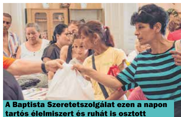
A Baptista Szeretetszolgálat ezen a napon tartós élelmiszert és ruhát is osztott