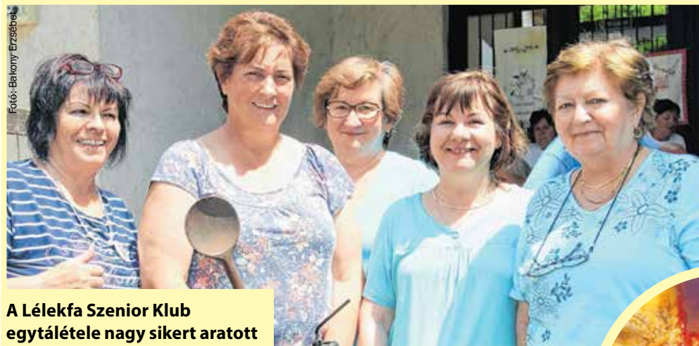
A Lélekfa Senior Klub egytálétele nagy sikert aratott

Az Idősügyi Tanács által meghirdetett „Nagykanizsa Legjobb Senior Szakácsa” főzőversenyre benevezett a Hevesi Sándor Művelődési Központ Lélekfa Senior Klubja is.